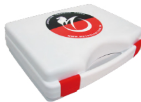
PG-9□H · PG-9□T 塞規(組)